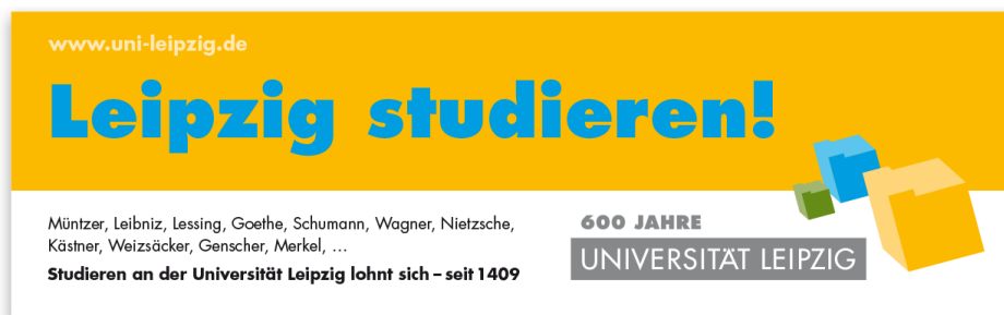
Imageanzeige für ein Studium an der Universität Leipzig im Zeit Studienführer 2008