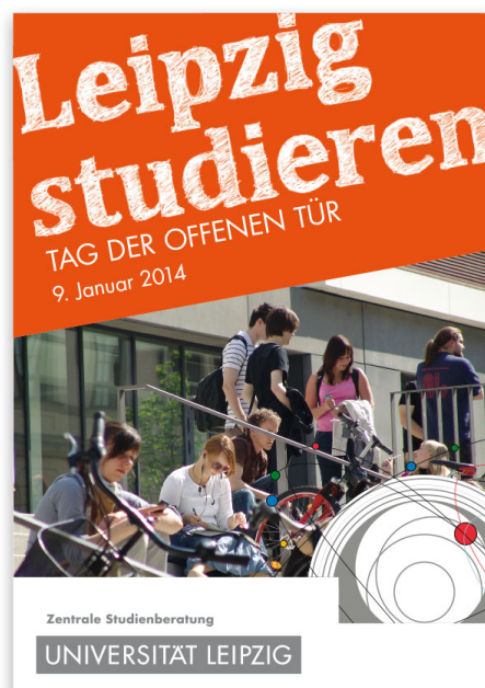
Jährlich erscheinende Informationsbroschüren zum »Tag der offenen Tür« und »Studieninformationstag«