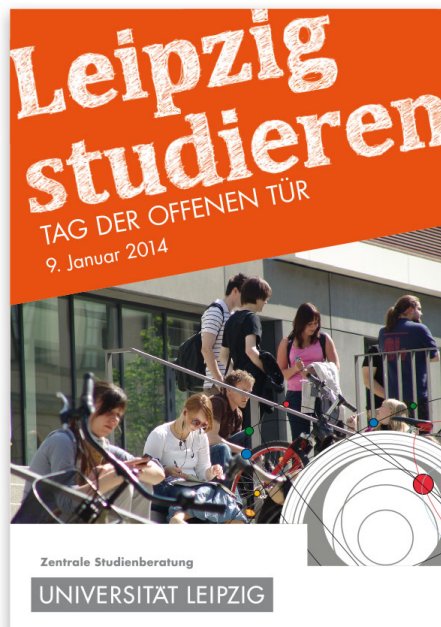
Jährlich erscheinende Informationsbroschüren zum »Tag der offenen Tür« und »Studieninformationstag«