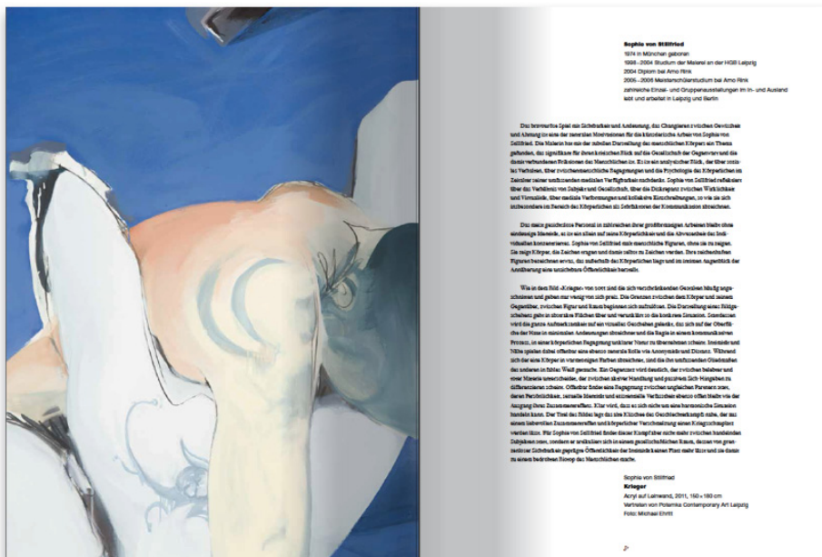
Ein Blick in den Katalog 2