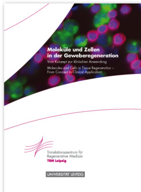
Titel Imagebroschüre TRM Leipzig