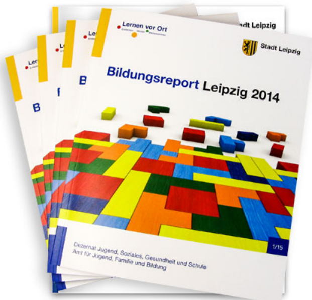
Titel des Bildungsreports

www.leipzig.de/news/news/bildungsreport-leipzig-2014-liegt-vor